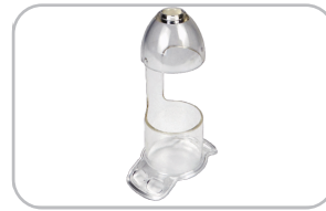
La sonda del brazo en C permite el tratamiento de hemorroides para masas más grandes, evitando problemas graves de estenosis en PPH.