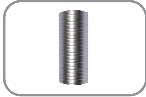
Cuerpo roscado para evitar deslizamiento