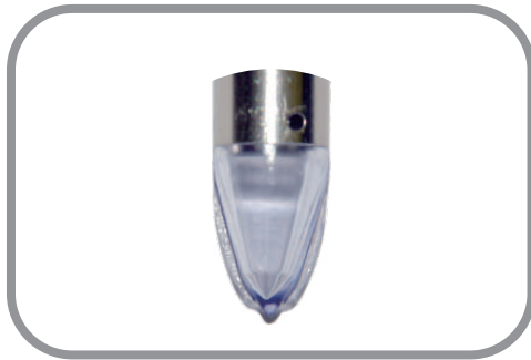
Diseño con aguja de punción – menos trauma, recuperación mas rápida