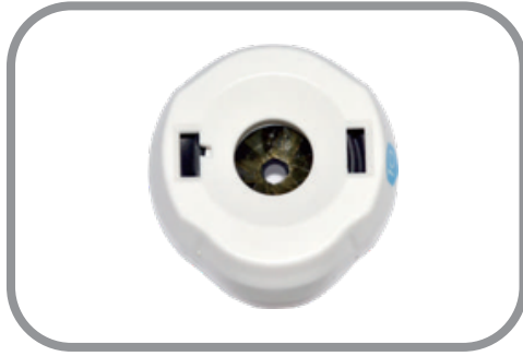
Válvula retráctil sin uso de reductor